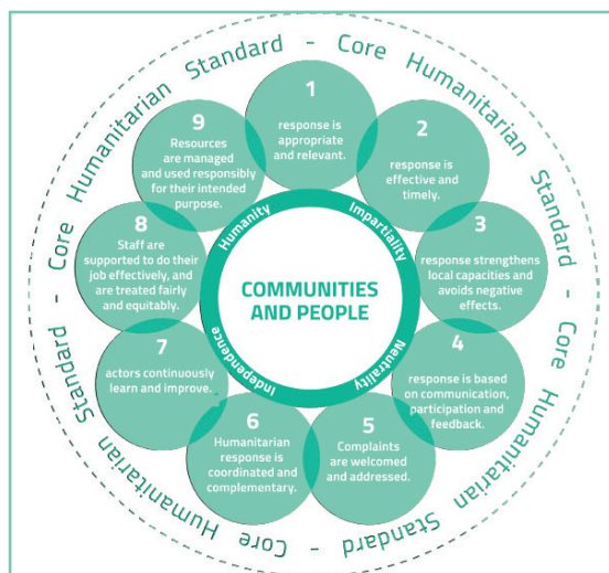
Fig. Standardet bazë humanitare për ndërhyrje të qëndrueshme 19

Qeveria, përmes masave, duhet të sigurojë respektimin e të drejtave të të gjithë fëmijëve që ka nën juridiksionin e saj – përfshirë fëmijët pa nënshtetësi - pavarësisht racës, gjinisë, moshës, fesë, përkatësisë etnike, mendimeve, aftësive të kufizuara apo ndonjë statusi tjetër të fëmijës, apo të prindërve të fëmijës ose kujdestarëve ligjorë 18 .